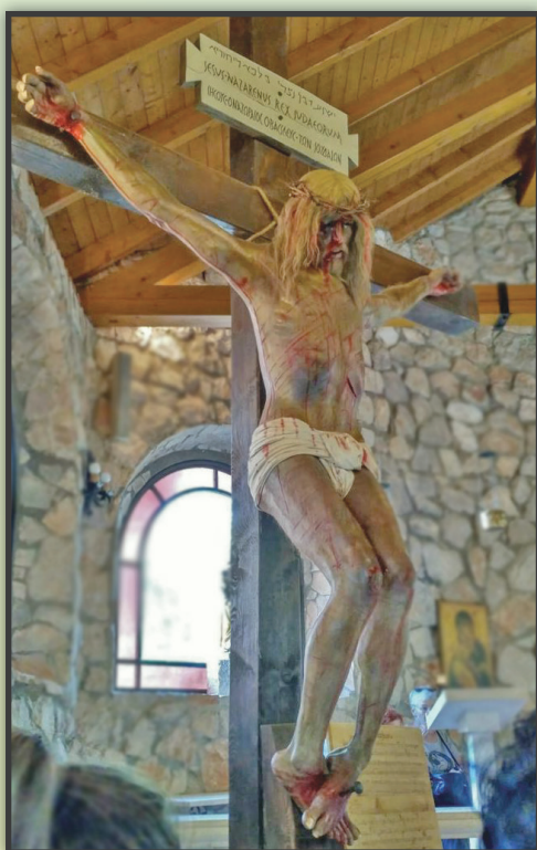
DEFINICJA MIŁOŚCI zdjęcie pochodzi z Medjugorie