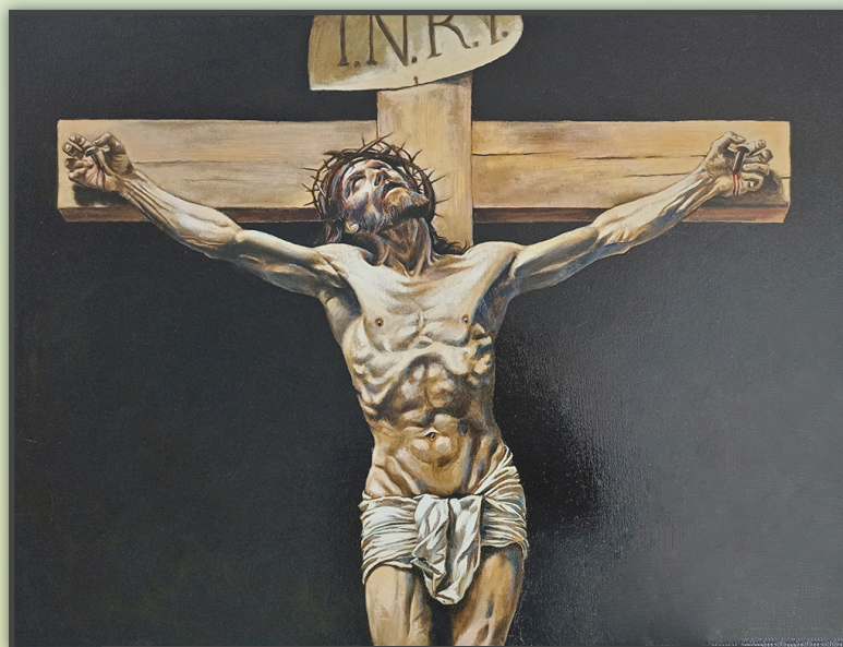
CHRYSTUS NA KRZYŻU Obraz malowano około 2 lat techniką olejną na płótnie