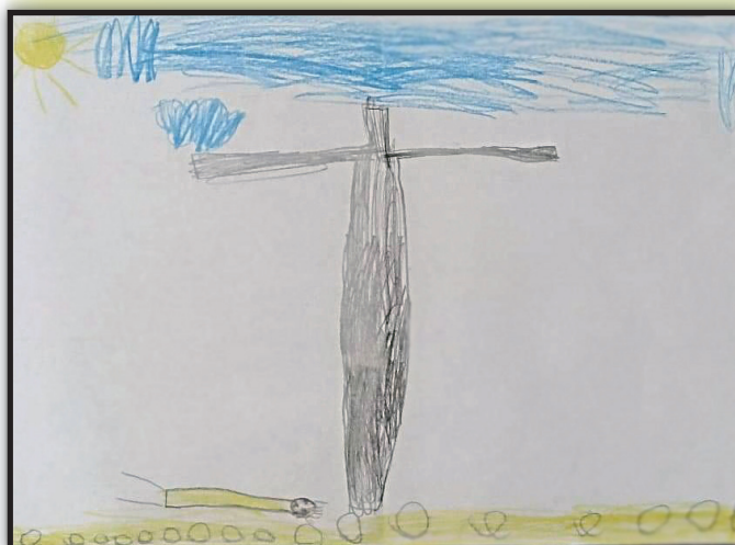
PAN JEZUS UPADA POD KRZYŻEM