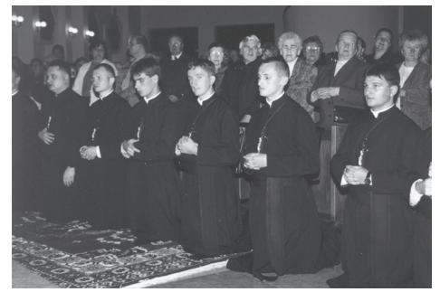
Na pamiątkę otrzymali krzyże...