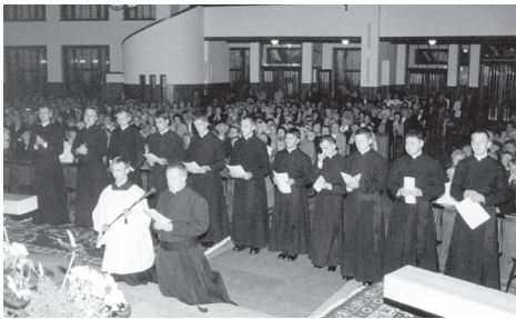
Tuż po homilii wszyscy klerycy przyrzekli...