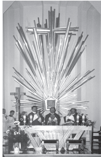
Na pamiątkę otrzymali krzyże, które mają im przypominać przyrzeczenia oraz ten szczególny dla nich dzień.

Tuż po homilii wszyscy klerycy przyrzekli czystość, ubóstwo, posłuszeństwo, wspólnotę dóbr i wytrwanie aż do śmierci w Stowarzyszeniu Apostolstwa Katolickiego, a później złożyli podpis pod aktem konsekracji.