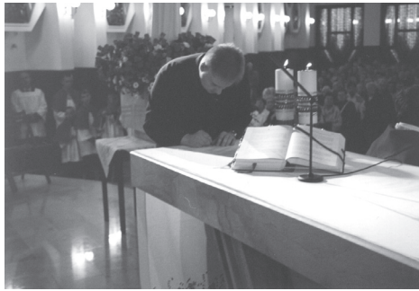
...a później złożyli podpis pod aktem konsekracji

14 września 2001r. w święto Podwyższenia Krzyża Świętego, w naszej parafii w czasie Mszy świętej odbyło się publiczne złożenie wiecznej profesji przynależności do Stowarzyszenia Apostolstwa Katolickiego. Do tak szczególnego aktu przystąpiło czternastu kleryków Wyższego Seminarium Duchownego z Ołtarzewa.