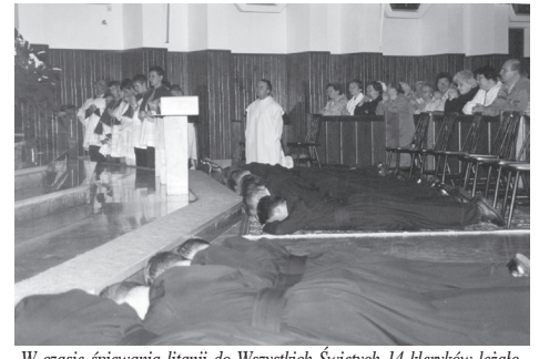
W czasie śpiewania litanii do Wszystkich Świętych 14 kleryków leżało krzyżem

Prośmy Dobrego Boga, by każdy z nich wytrwał w swym powołaniu, świadcząc o Chrystusie, bo „żniwo wkoło wielkie, robotników mało, wezwij Panie z ludu swego sługi dla Twej chwały. Aby Twa Owczarnia miała dość pasterzy, pošlij nam kapłanów dla wzmocnienia w wierze. Żniwo wkoło wielkie, sam to rzekłeś Panie, wezwij robotników na kłósów zbieranie”.