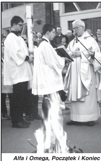
Alfa i Omega, Początek i Koniec