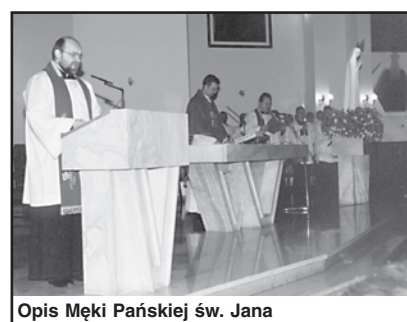
Opis Męki Pańskiej św. Jana