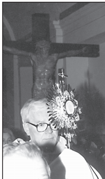
Ks. Proboszcz przenosi P. Jezusa z grobu na Mszę Rezurekcyjną