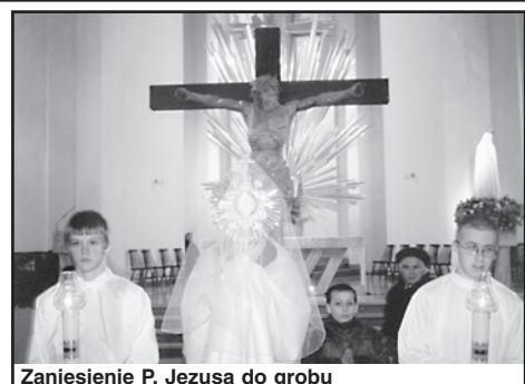
Zaniesienie P. Jezusa do grobu