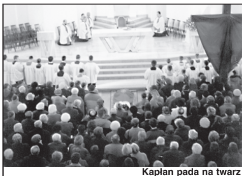
Kapłan pada na twarz

Liturgia na cześć Męki Pańskiej celebrowana była w trzech częściach: liturgia słowa, adoracja krzyża wraz z komunią świętą i przeniesienie do grobu. Czerwony kolor szat liturgicznych przypominał nam Mękę Chrystusa, którą podjął z miłości do człowieka. Celebrans upadł na