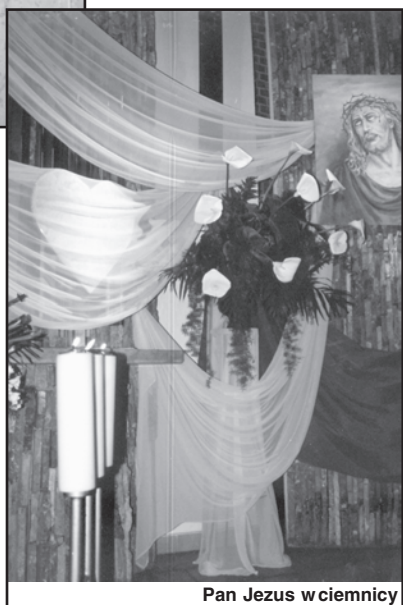
Pan Jezus w ciemnicy

antyfonę: „Oto drzewo krzyża, na którym zawisło zbawienie świata”, a my odpowiadaliśmy: „Pójdźmy z pokłonem”. Po każdej odpowiedzi klękaliśmy i przez chwilę oddawaliśmy w milczeniu część Krzyżowi. Później rozpoczęły się obrzędy Komunii św., każdy mógł osobiście ucałować krzyż. Zgodnie