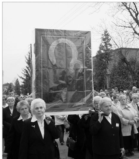
Matki naszej parafii niosące Cudowny Obraz

Uroczystości rozpoczęły się Nabożeństwem Oczekiwania o godz. 16.30 przy figurce u zbiegu ulic: Młodzianowskiej, Wiejskiej i Orzechowej. O godz. 17.00 przybył cudowny