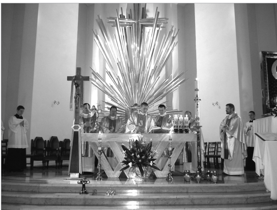
Księża pochodzący z naszej parafii celebrują Mszę świętą o godz. 24.00