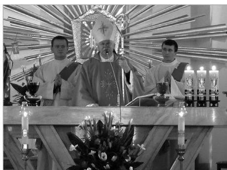
Msza święta, podczas której udzielono sakramentu bierzmowania