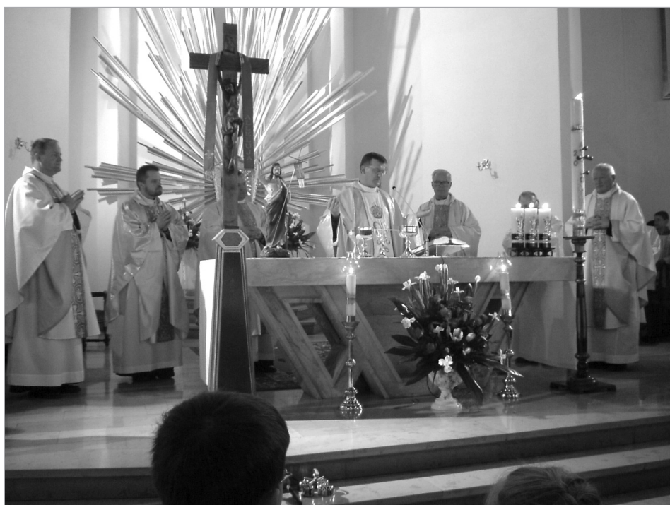
Msza kończąca obecność Obrazu w naszej parafii