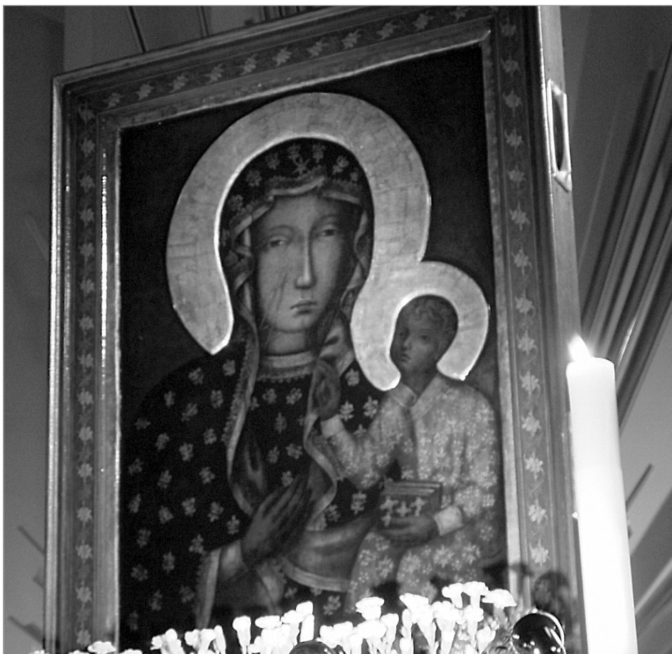
Matka troskliwie patrząca na swoje dzieci

całemu zespołowi duszpasterskiemu – Księżom i Siostram Zakonnym, Służbie Liturgicznej i wszystkim Grupom Parafialnym oraz Wszystkim Wiernym, którzy tak licznie przyszli na powitanie i pożegnanie Maryi, którzy czuwali przy Matce w dzień i w nocy. Bóg Zapłać!