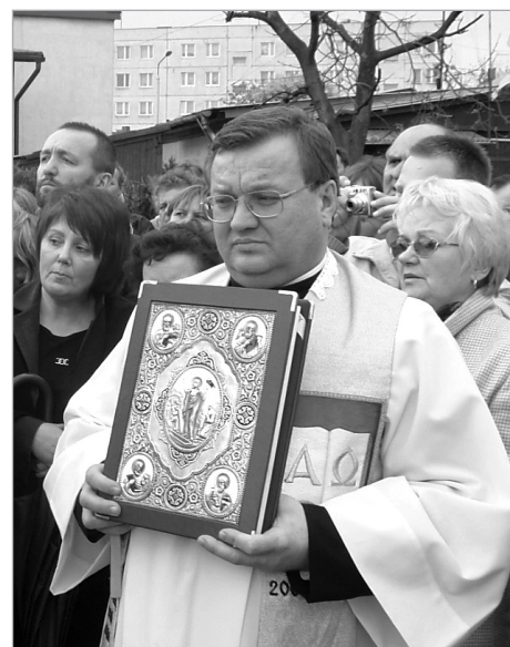
Ks. Proboszcz z zalem spogląda na odjeżdżającą Matkę